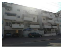
מצללות לא אחידות לכל המרפסות