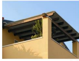
מצללה לא תחרוג מקו המרפסת

5) במצללה לא יותר לשלב חומר אטום מכל סוג. יותר שימוש ביריעות קנים, קש וכדומה. 6) לא ישולבו מרחבים ותעלות ניקוז במצללות.